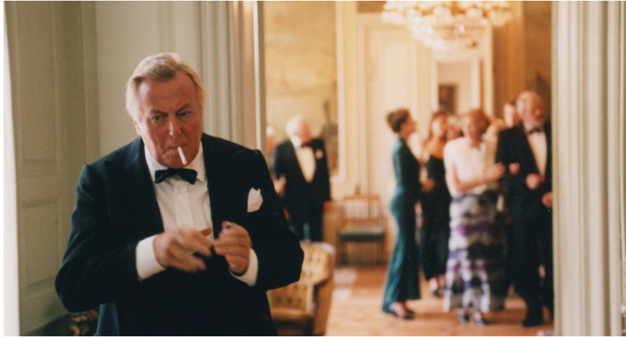
Still: Festen, Thomas Vinterberg, 1995.

Improvisation er en spontan, fri og kreativ måde at udvikle idéer og fortællinger på. Men ligesom det kræver megen øvelse at kunne improvisere på et musikinstrument, kræver improvisation indenfor film en klar rammesætning og stor tillid mellem deltagerne på holdet. Improvisation kræver mod til at turde stå frem – men det kræver i lige så høj grad evnen til at lytte, gribe andres idéer og give plads.