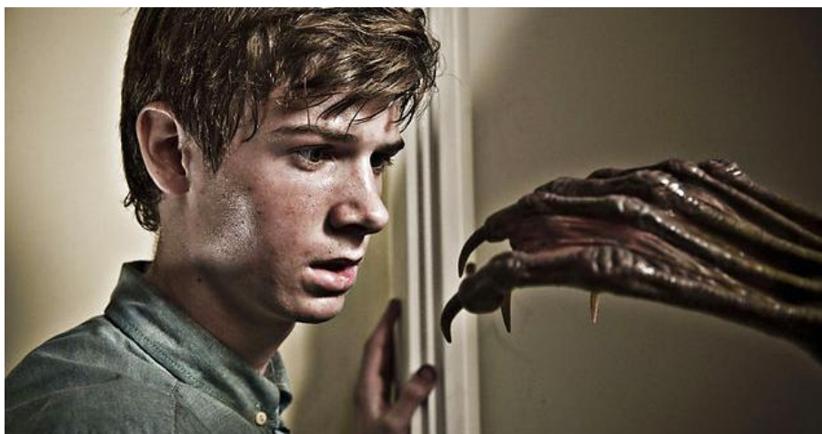
Stil: Dannys Dommedag, Martin Barnewitz 2014

I gysersfilmgenren spilles der ofte på filmens mest effektive virkemidler. Eleverne producerer i dette FILM-X forløb en gysersfilm på 1-2 minutter i vores autentiske studierammer, hvor de afprøver og anvender gysersfilmgenrens virkemidler i fortælling, scenografi, lyd og klipning.