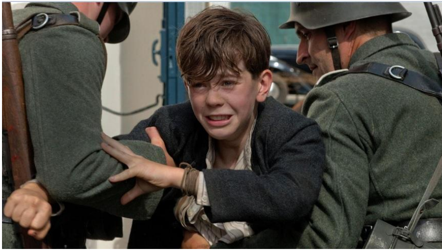
Still: Krigens Hemmeligheder

Der er en lang tradition for at skildre vores historie gennem fiktive fortællinger. Eksempler er filmen "En kongelig affære", tv-serierne "1864" og ikke mindst "Matador", der med utallige genudsendelser i dag har sat sig som en kollektiv bevidsthed om livet i Danmark omkring 2. verdenskrig.