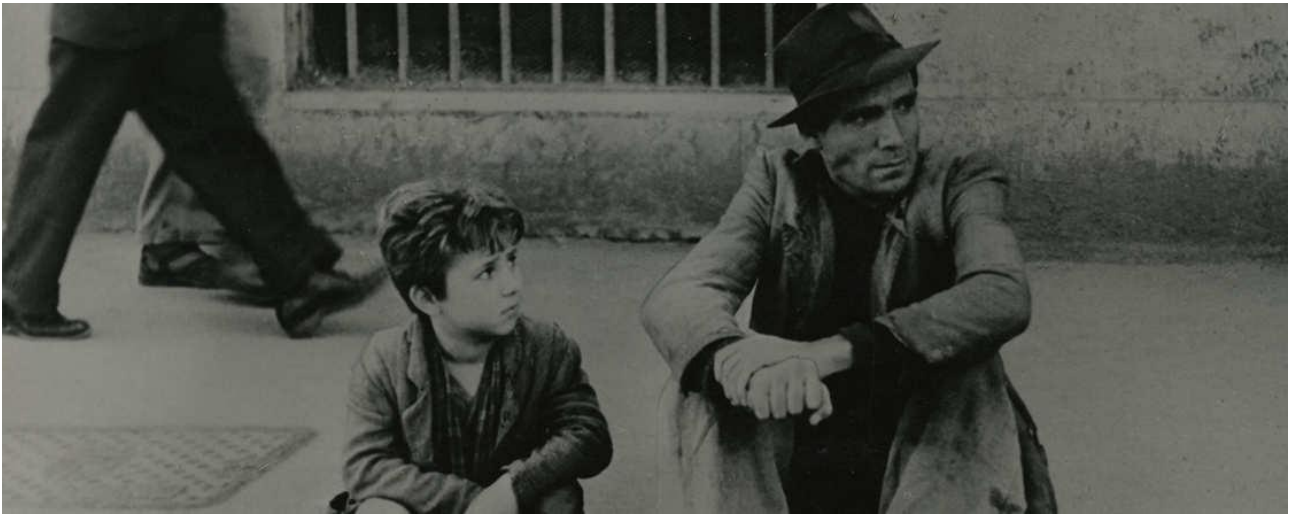
Still: Cykeltyven, 1948.

Filmen har som kunstart udviklet sig enormt i de 120 år, som mediet har eksisteret. Film fortæller historier - men måden hvorpå dette gøres er utrolig alsidig. Vi indleder forløbet med at kigge på de virkemidler, som kendetegner de tre stilarter: Stumfilm , Magisk realisme og Socialrealisme . Eleverne skaber deres egne film på 1-2 minutter med udgangspunkt i hver sin stilart, og filmholdene skal anvende trækkene i både filmens fortælling og æstetik.