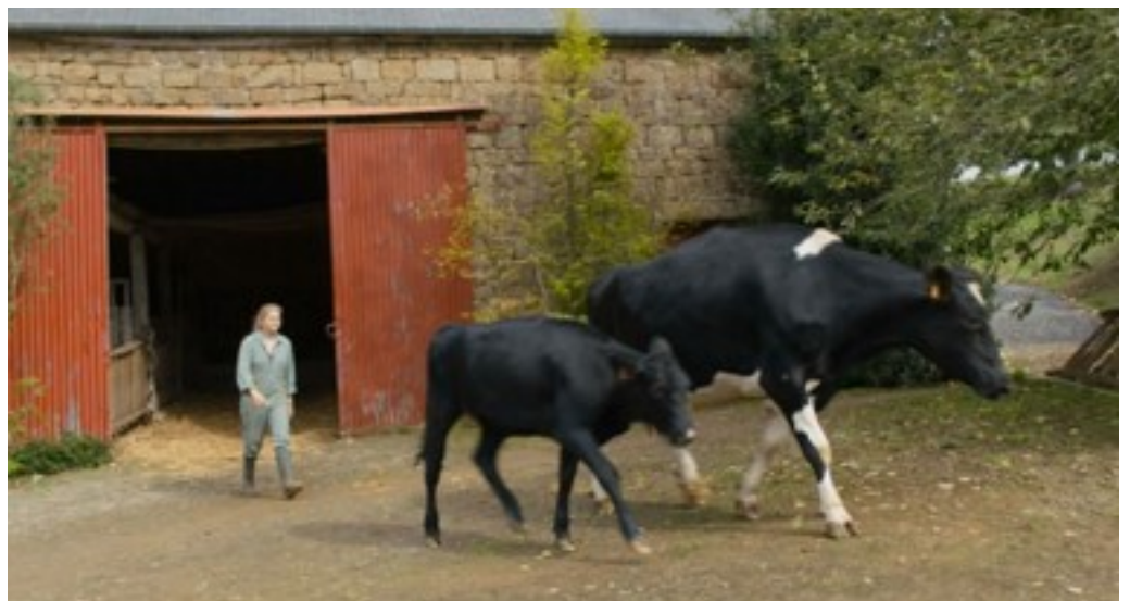
Paula hjælper til på gården