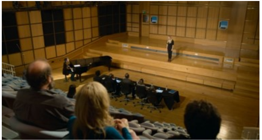
Under sangprøven i Paris, (foto: framegrab)

Gå sammen i par. Skriv en personkarakteristik af Paula. I skal inddrage mindst to af stillbillederne herunder og placere dem i kontraktmodellen.