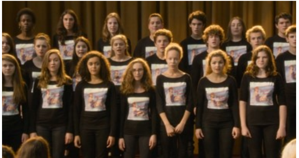
Koncerten på gymnasiet, (foto: framegrab)