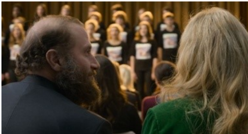
Forældrene under koncerten. Er deres opførsel uhøflig? , (foto: framegrab)