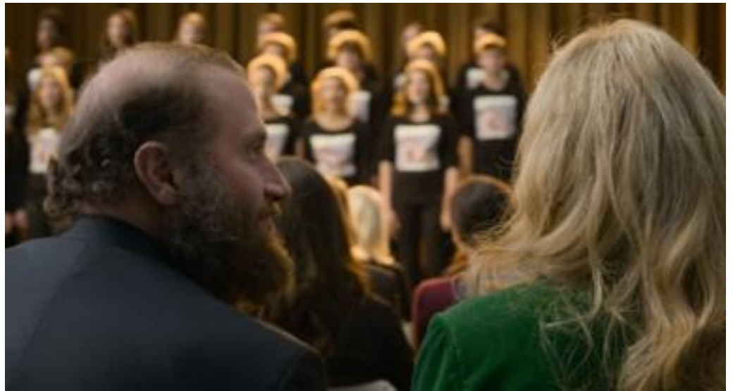
Forældrene under koncerten. Er deres opførsel uhøflig? , (foto: framegrab)