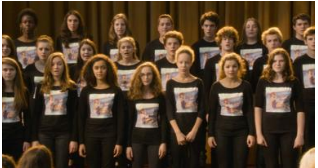
Koncerten på gymnasiet, (foto: framegrab)