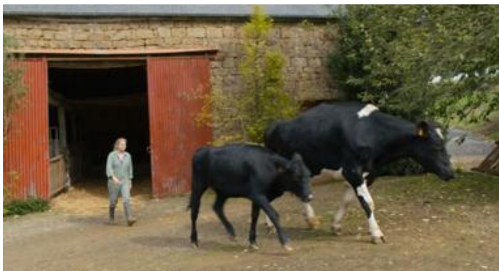
Paula hjælper til på gården, (foto: framegrab)