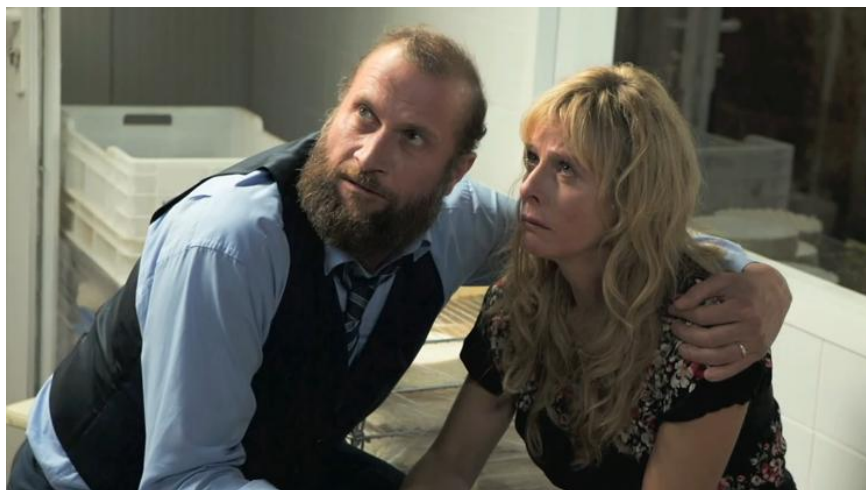
La réaction des parents, (foto : Scanbox)