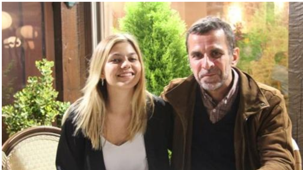
Louane Emera et le réalisateur Éric Lartigau