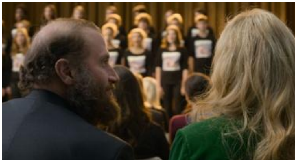
Les parents pendant le concert au lycée. Est-ce qu'ils sont impolis?