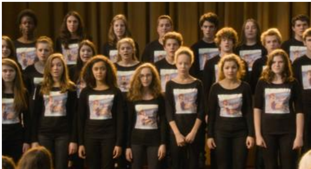
Le concert au lycée