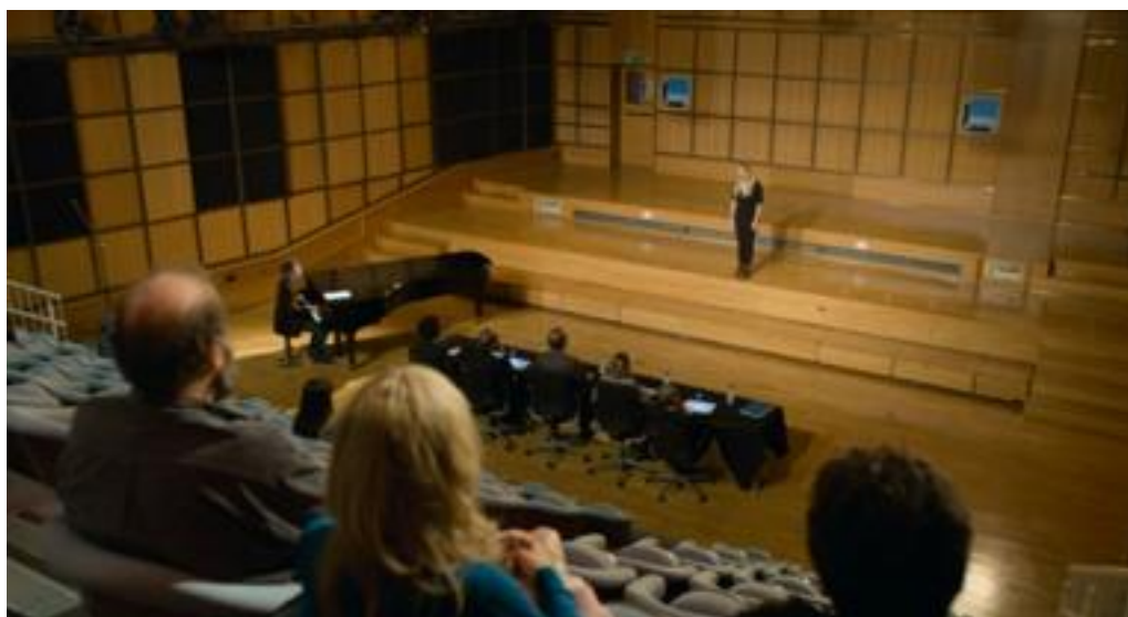
Pendant le concours (sangprøven), (foto: framegrab)