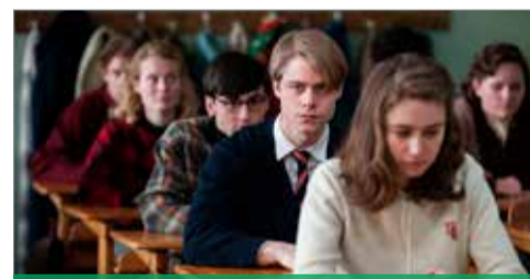
NB. Særrangementer med Salaam Filmfestival udvides med ekstra 30 min. til oplægsholder

8.-10. KLASSE, GYMNASIET OG UNGDOMSUDDANNELSERNE