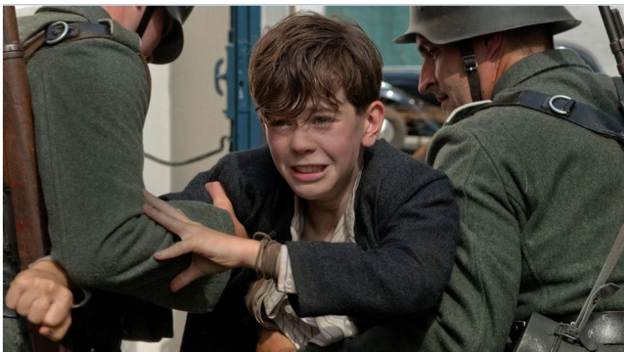
Stil: Krigens Hemmeligheder

Der er en lang tradition for at skildre vores historie gennem fiktive fortællinger, og igennem disse bliver vi mindet om både skælsættende begivenheder, personligheder og hverdagslivets vilkår.