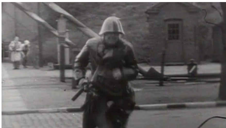
Indklip til baggrundsfilmene "Gyden" i Studie 1.

Der er en lang tradition for at skildre vores historie gennem fiktive fortællinger, og igennem disse bliver vi mindet om både skælsættende begivenheder, personligheder og hverdagslivets vilkår.