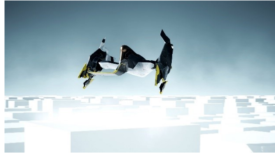
Indklip fra Rumskibet, Studie 3

Clifi er en undergenre til science fiction, der fokuserer på klimaforandringer. Filmene er typisk dystopiske og skræmmende, men oftest rummer de også håb. I dette forløb skal eleverne skabe en filmfortælling med deres egen forestillinger om klimaet i fremtiden.