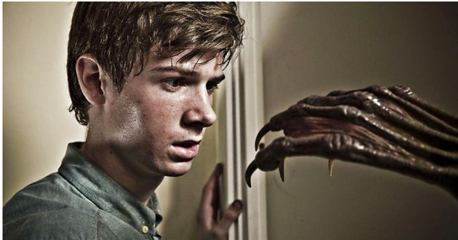
Stil: Dannys Dommedag, Martin Barnewitz 2014

I gyserfilmgenren spilles der ofte på filmens mest effektive virkemidler. Eleverne producerer i dette FILM-X forløb en gyserfilm på 1-2 minutter i vores autentiske studierammer, hvor de afprøver og anvender gyserfilmgenrens virkemidler i fortælling, scenografi, lyd og klipping.