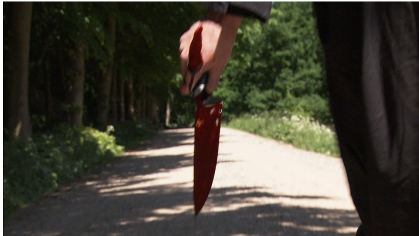
Indklip til baggrundsfilmene Skovvejen, Studie 4

I gyserfilmgenren spilles der ofte på filmens mest effektive virkemidler. Eleverne producerer i dette FILM-X forløb en gyserfilm på 1-2 minutter i vores autentiske studierammer, hvor de afprøver og anvender gyserfilmgenrens virkemidler i fortælling, scenografi, lyd og klipping.