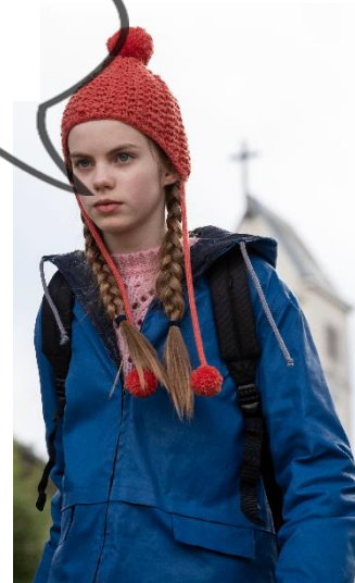
© Ricardo Vaz Palma - In Good Company