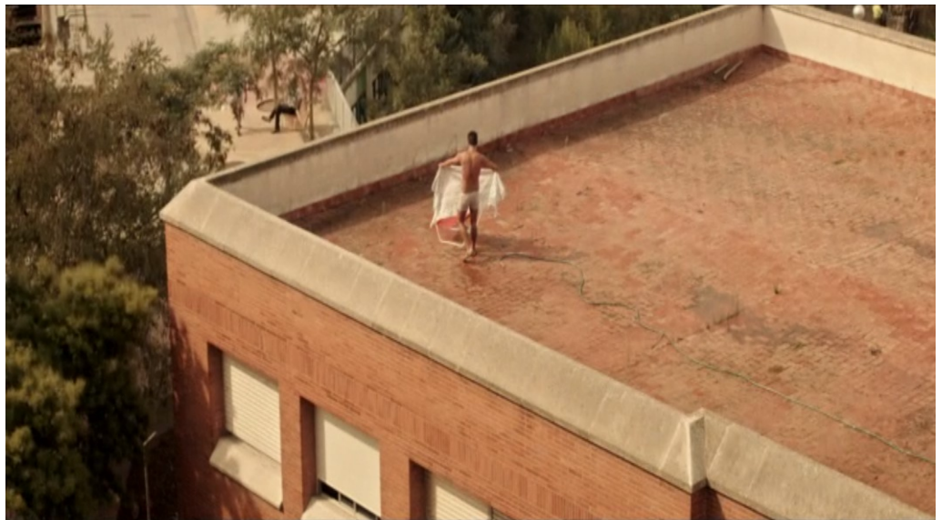
Screenshot fra 'En la azotea' (02.02)