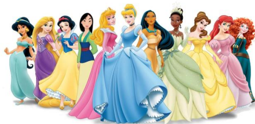
Illustration af Disneys prinsesser. Hvilke signaler om køn og kvindelighed sender de?

Tænk over sidste gang, du var i en tøjforretning, så en tegnefilm eller så reklamer for legetøj på TV eller på nettet. Oplevede du specifikke værdier eller normer knyttet til køn?