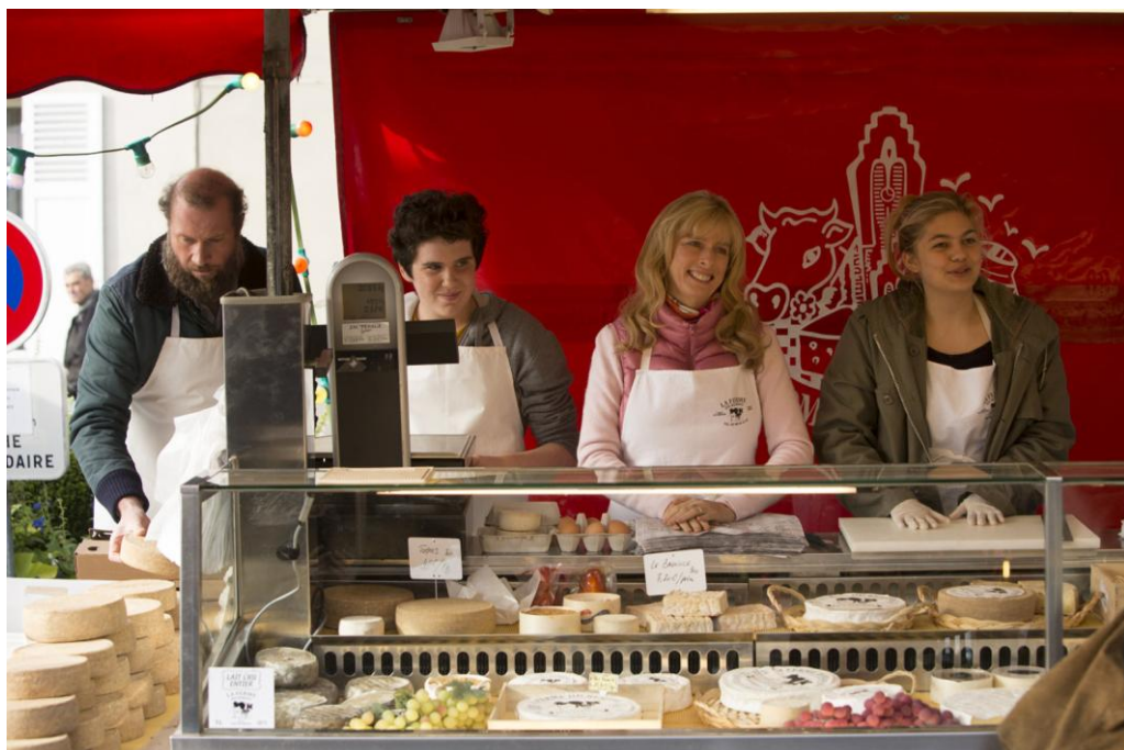
B : La famille Bélier au marché pour vendre ( sælg ) du fromage.

B: Gå herefter sammen med en klassekammerat, som har arbejdet med det andet billede. Læs jeres sætninger højt for hinanden om jeres billede.