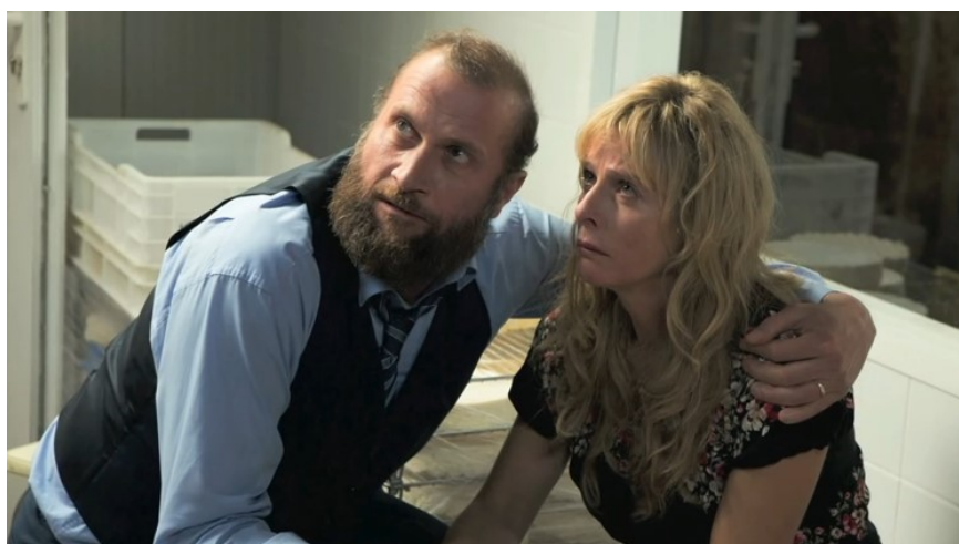
La réaction des parents, (foto : Scanbox)