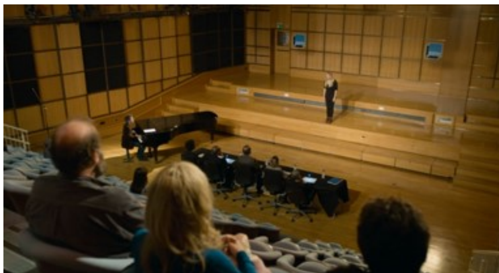
Pendant le concours (sangprøven), (foto: framegrab)