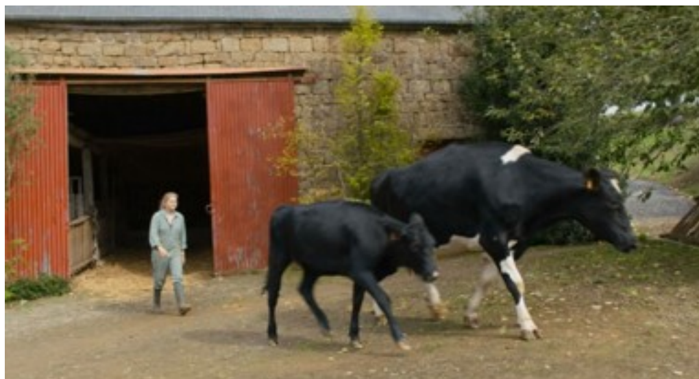
Paula à la ferme, (foto: framegrab)