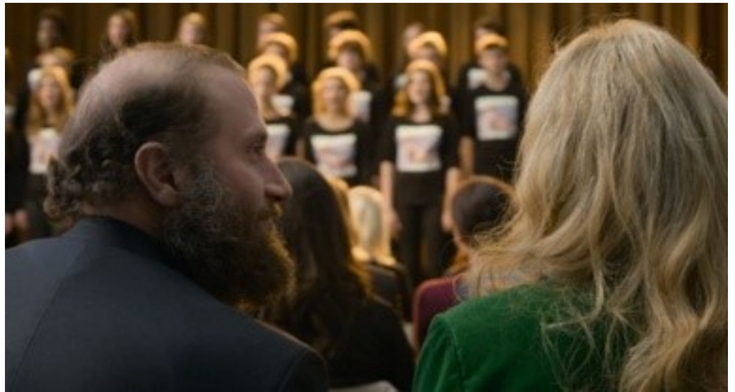
Les parents pendant le concert au lycée. Est-ce qu'ils sont impolis?, (foto: framegrab)