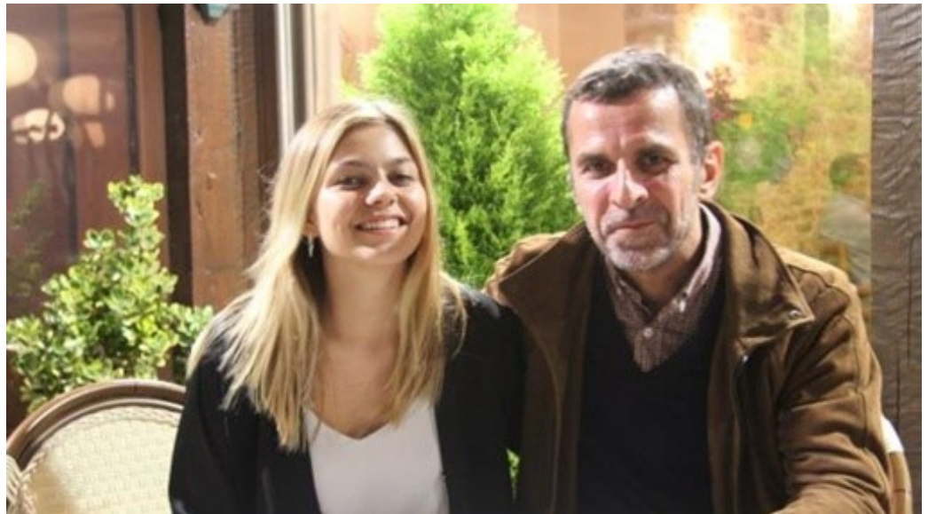
Louane Emera et le réalisateur Éric Lartigau