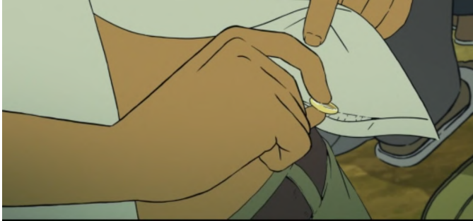
la confiscation des biens personnels