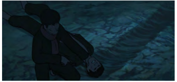
les exécutions en public