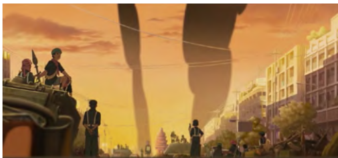
l'évacuation de force de la capitale

Quels sont les abus commis par les Khmers rouges envers la population ? Ajoutez une légende pour chaque image.