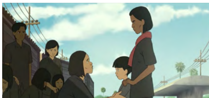
l'enlèvement des enfants, envoyés dans des camps pour enfants