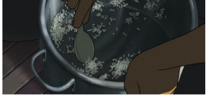
le manque d'approvisionnement en nourriture