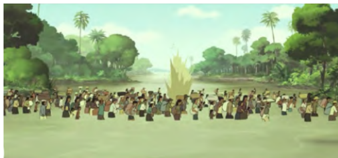
l'exode forcé vers les campagnes