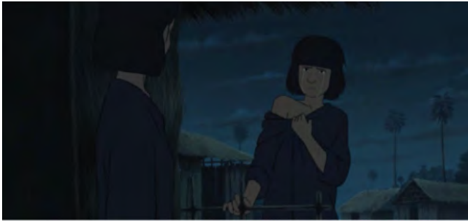
le viol de jeunes femmes