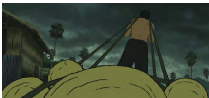
le travail forcé