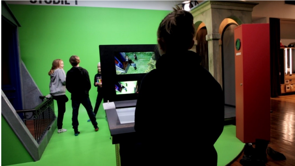
Filmhold under optagelse i Studie 1

Rigtig mange film er baseret på populære bøger. Men hvad er egentlig filmens særlige styrker? Og hvad er litteraturens? Eleverne skal i FILM-X selv arbejde med at producere en filmscene med inspiration fra en novelle. Formålet er, at give eleverne dybere forståelse for, hvilke virkemidler og kunstneriske udtryk der kendetegner hhv. litteratur (ved novellen som eksempel) og film.