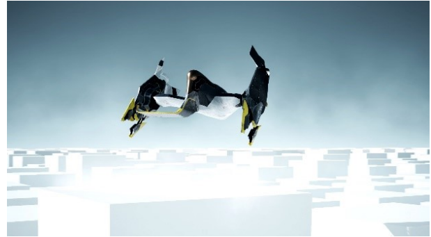
Indklip fra Rumskibet, Studie 3

Clifi er en undergenre til science fiction, der fokuserer på klimaforandringer. Filmene er typisk dystopiske og skræmmende, men oftest rummer de også håb. I dette forløb skal eleverne skabe en filmfortælling med deres egen forestillinger om klimaet i fremtiden.