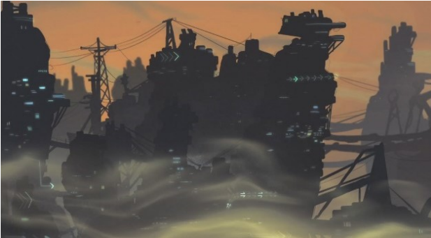
Indklip fra Storbyen, Studie 2